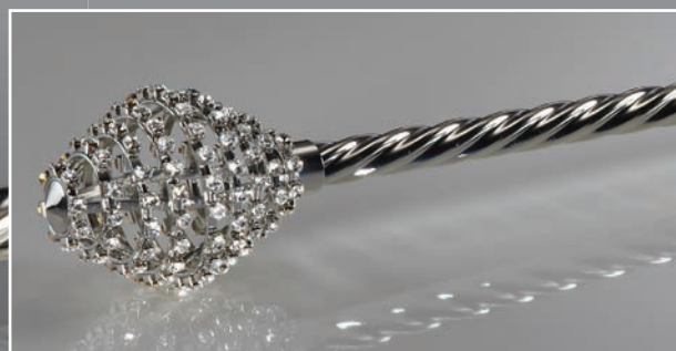
Zepter z05 - ca. 52 cm