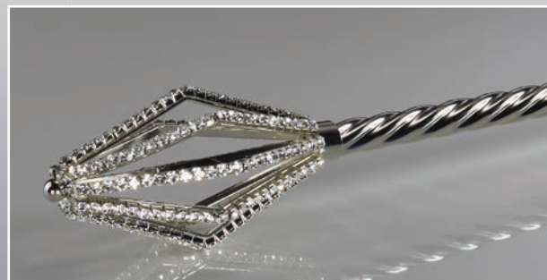
Zepter z04 - ca. 57 cm